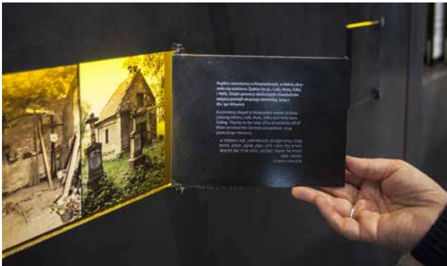
Fragment multimedialnej ekspozycji Muzeum w Markowej, marzec 2016 r.