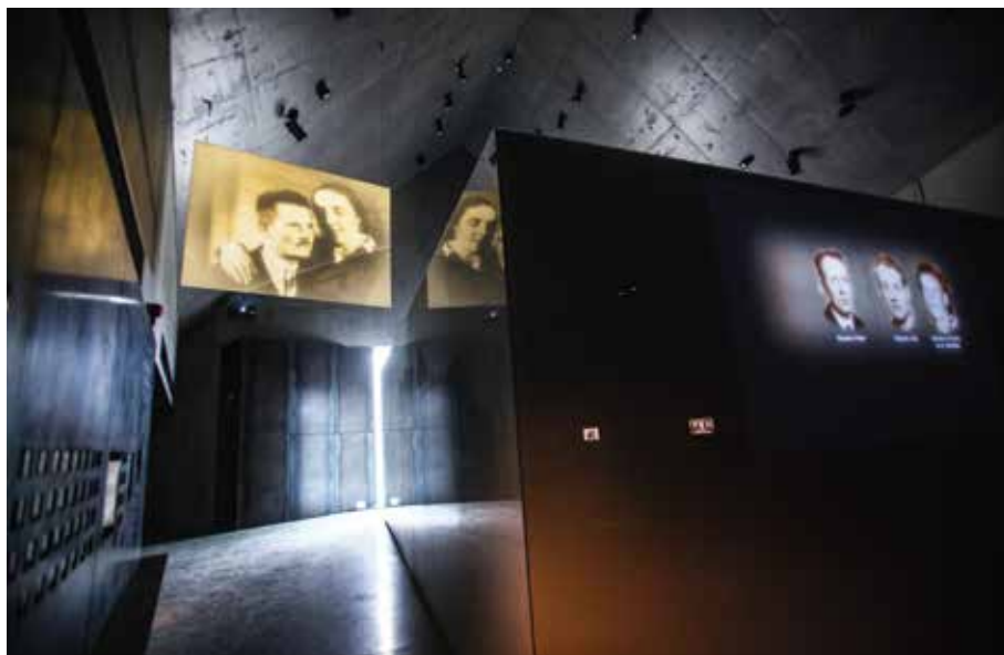
Wnętrze Muzeum w Markowej, marzec 2016 r.