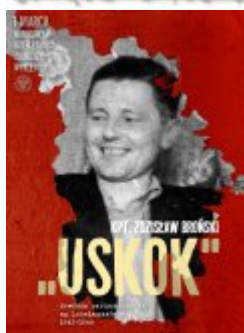
Plakat do pobrania