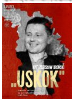
Plakat do pobrania