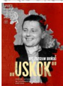
Plakat do pobrania