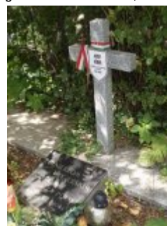
Fragment mogiły żołnierzy węgierskich na cmentarzu w Podkowie Leśnej