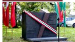
Uroczystość odsłonięcia pomnika pamięci Węgierskich Honwedów, którzy wsparli Powstańców Warszawskich - Warszawa, 19 września 2017.