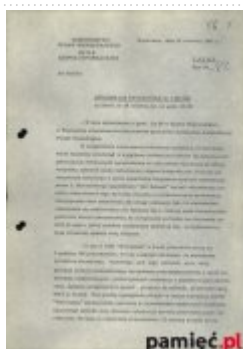
Informacja dzienna MSW dotycząca procesu przywódców KPN, 16 czerwca 1981 (1)

Konfederacja Polski Niepodległej na drodze do wolności , red. M. Wenklar, Kraków 2011