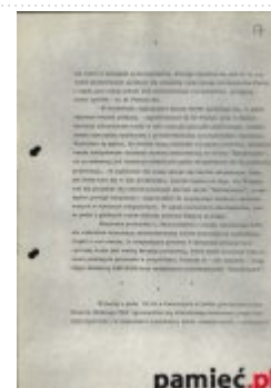
Informacja dzienna MSW dotycząca procesu przywódców KPN, 16 czerwca 1981 (3)