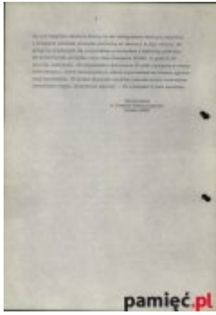
Informacja dzienna MSW dotycząca procesu przywódców KPN, 16 czerwca 1981 (4)