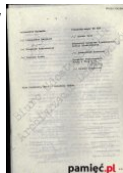
Porozumienie katowickie, 11 września 1980 r.

S. Krzyżanowska, W. Trębacz, Narodziny Solidarności. Niezależny Samorządny Związek Zawodowy 1980-1981. Materiały edukacyjne dla nauczyciela i ucznia - wszystkie poziomy kształcenia , Wrocław 2011