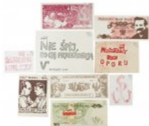
Pamiątki pochodzące z kolekcji rodziny Komierowskich