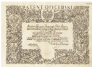
Patent oficerski pplk. Witolda Komierowskiego nadany przez Ministra Spraw Wojskowych