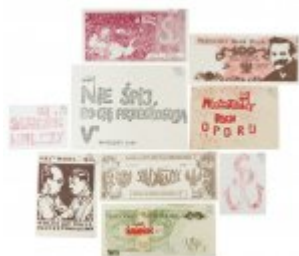
Pamiątki pochodzące z kolekcji rodziny Komierowskich