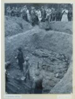
Fernand de Brinon latem 1943 roku w miejscu ekshumacji ofiar zbrodni katyńskiej