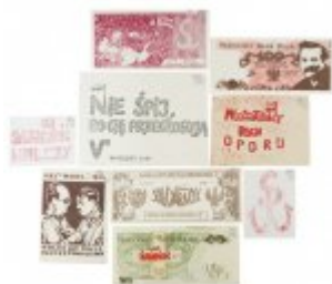
Pamiętki pochodzące z kolekcji rodziny Komierowskich