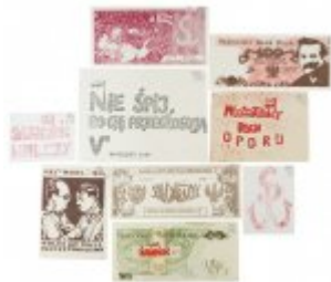
Pamiątki pochodzące z kolekcji rodziny Komierowskich