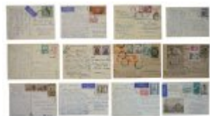
Korespondencja Stanisława Tylingo