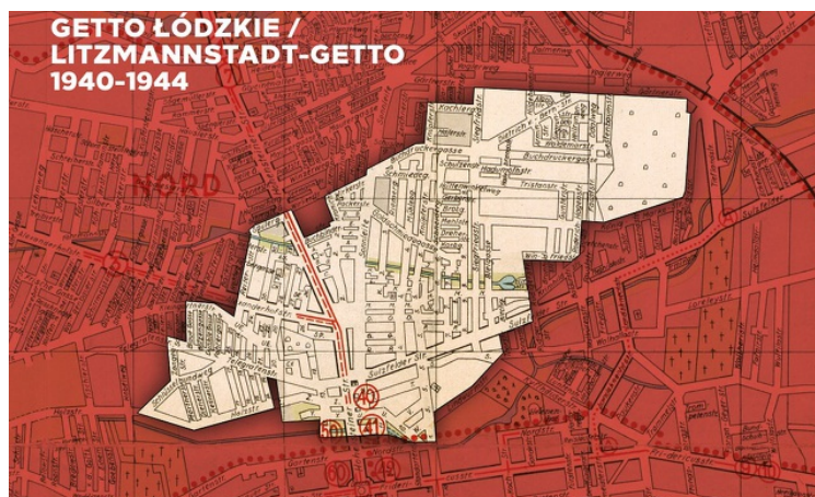
Śladami łódzkiego getta - przewodnik audio po terenie byłego Litzmannstadt Getto, przygotowany przez Oddział IPN w Łodzi, dostępny na platformie Audiotrip. Polecamy!

Administracja żydowska getta objęła niemal każdą dziedzinę życia więźniów „dzielnicę zamkniętej”. Oprócz komórek prowadzących ewidencję ludności i produkcji istniały m.in. rozbudowana służba zdrowia (szpitale, przychodnie i pogotowie ratunkowe), policja, sąd, straż pożarna, wewnętrzna poczta, a także system szkolny, kolonie letnie oraz komórki zajmujące się wywozem nieczystości, transportem towarów czy produkcją rolną. Absolutnym fenomenem był działający oficjalnie w getcie Wydział Archiwum, zbierający dokumentację dotyczącą niemal każdej dziedziny życia w „dzielnicę zamkniętej”, który można porównać jedynie z konspiracyjną działalnością grupy Oneg Szabat i jej archiwum getta warszawskiego. Listę można by rozszerzyć o kilkadziesiąt rozmaitych wydziałów, referatów, komisji i biur, będących swojego rodzaju „otoczonym drutem państwem”. W szczytowym okresie w administracji było zatrudnionych ponad 14 tys. pracowników (17 proc. ogółu pracujących w getcie), co było wyjątkowo wysokim odsetkiem w porównaniu z innymi „dzielnicami zamkniętymi”.