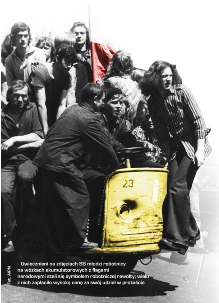
Uwiecznieni na zdjęciach SB młodzi robotnicy na wózkach akumulatorowych z flagami narodowymi stali się symbolem robotniczej rewolty; wielu z nich zapłaciło wysoką cenę za swój udział w proteście

Na uczestników protestów z czerwca 1976 roku, mniej gwałtownych i o mniejszym zasięgu niż tych z czerwca 1956 czy grudnia 1970 roku, spadły dużo ostrzejsze represje niż podczas wcześniejszych „ polskich miesięcy ”. Możemy mówić o paradoksie?