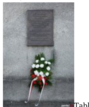
Tablica na murze zakładu karnego w Tarnowie