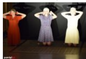
75. rocznica pierwszego transportu