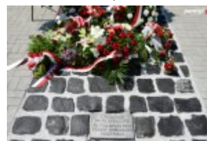
Fragment pomnika w Tarnowie

Zaprowadzono nas do niewielkiego budynku więziennego w Muszynie. W nocy do cel wpadli gestapowcy i tłukli więźniów. W poniedziałek przewieźli nas na przesłuchanie do willi „Kujawianka”. Notabene byłem w niej również po wojnie, w latach siedemdziesiątych, wówczas było tam... sanatorium. Chciałem, by umieszczono tablicę upamiętniającą te wydarzenia, ale władze miejskie nie były tym wówczas zainteresowane.