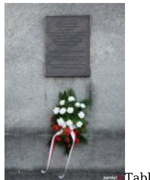
Tablica na murze zakładu karnego w Tarnowie