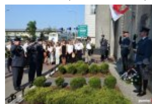
Uroczystości 75. rocznicy pierwszego transportu polskich więźniów politycznych do KL Auschwitz przed tablicą na murze zakładu karnego w Tarnowie, czerwiec 2015

Kolejnym etapem więziennej drogi stał się z początkiem maja 1940 roku Tarnów, gdzie był jeden z największych zakładów karnych na południu Polski. 12 czerwca 1940 roku rozeszła się po rurach wiadomość alfabetem Morse'a, że wyjeżdżamy, prawdopodobnie na roboty do Niemiec. Cieszyliśmy się z tego, bo najcięższa praca w Rzeszy wydawała nam się znośniejsza od wegetacji w zamkniętym pudle. Emocje ogromne. Następnego dnia wywołano nas z cel na duży dziedziniec, w sumie 728 osób, przeważnie młodych ludzi. Poprowadzono nas przez miasto na dworzec, policjanci niemieccy cały czas patrolowali po bokach, zapowiedzieli, że jeżeli ktoś w ogóle wyjdzie z szeregu zostanie zastrzelony, szansy ucieczki nie było. Załadowano nas do pociągu pasażerskiego starego typu. W każdym przedziale słoczono po dziesięć osób, na korytarzu stali funkcjonariusze Schutzpolizei. Po paru godzinach pociąg zatrzymał się na dworcu głównym w Krakowie. 14 czerwca 1940 roku lato było upalne, okna mieliśmy zamknięte, ale szupowcy otwierali te na