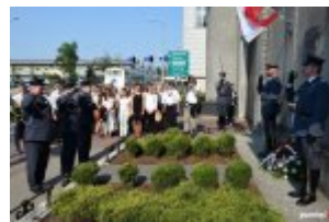
Uroczystości 75. rocznicy pierwszego transportu polskich więźniów politycznych do KL Auschwitz przed tablicą na murze zakładu karnego w Tarnowie, czerwiec 2015

Kolejnym etapem więziennej drogi stał się z początkiem maja 1940 roku Tarnów, gdzie był jeden z największych zakładów karnych na południu Polski. 12 czerwca 1940 roku rozeszła się po rurach wiadomość alfabetem Morse'a, że wyjeżdżamy, prawdopodobnie na roboty do Niemiec. Cieszyliśmy się z tego, bo najcięższa praca w Rzeszy wydawała nam się znośniejsza od wegetacji w zamkniętym pudle. Emocje ogromne. Następnego dnia wywołano nas z cel na duży dziedziniec, w sumie 728 osób, przeważnie młodych ludzi. Poprowadzono nas przez miasto na dworzec, policjanci niemieccy cały czas patrolowali po bokach, zapowiedzieli, że jeżeli ktoś w ogóle wyjdzie z szeregu zostanie zastrzelony, szansy ucieczki nie było. Załadowano nas do pociągu pasażerskiego starego typu. W każdym przedziale słoczono po dziesięć osób, na korytarzu stali funkcjonariusze Schutzpolizei. Po paru godzinach pociąg zatrzymał się na dworcu głównym w Krakowie. 14 czerwca 1940 roku lato było upalne, okna mieliśmy zamknięte, ale szupowcy otwierali te na