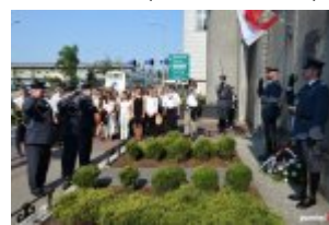
Uroczystości 75. rocznicy pierwszego transportu polskich więźniów politycznych do KL Auschwitz przed tablicą na murze zakładu karnego w Tarnowie, czerwiec 2015

Kolejnym etapem więziennej drogi stał się z początkiem maja 1940 roku Tarnów, gdzie był jeden z największych zakładów karnych na południu Polski. 12 czerwca 1940 roku rozeszła się po rurach wiadomość alfabetem Morse'a, że wyjeżdżamy, prawdopodobnie na roboty do Niemiec. Cieszyliśmy się z tego, bo najcięższa praca w Rzeszy wydawała nam się znośniejsza od wegetacji w zamkniętym pudle. Emocje ogromne. Następnego dnia wywołano nas z cel na duży dziedziniec, w sumie 728 osób, przeważnie młodych ludzi. Poprowadzono nas przez miasto na dworzec, policjanci niemieccy cały czas patrolowali po bokach, zapowiedzieli, że jeżeli ktoś w ogóle wyjdzie z szeregu zostanie zastrzelony, szansy ucieczki nie było. Załadowano nas do pociągu pasażerskiego starego typu. W każdym przedziale słoczono po dziesięć osób, na korytarzu stali funkcjonariusze Schutzpolizei. Po paru godzinach pociąg zatrzymał się na dworcu głównym w Krakowie. 14 czerwca 1940 roku lato było upalne, okna mieliśmy zamknięte, ale szupowcy otwierali te na