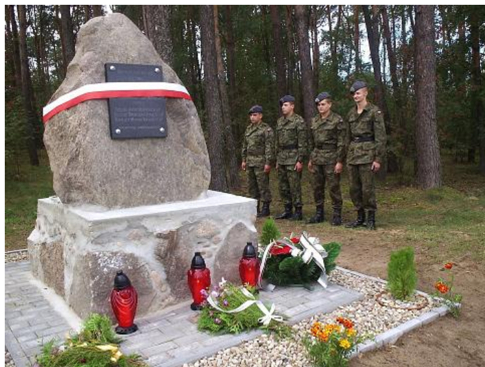
Żołnierze z pobliskiej jednostki w czasie honorowej warty