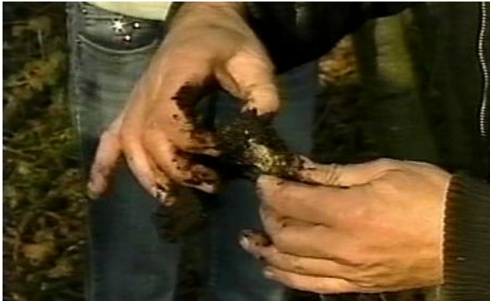
Liczył się każdy skrawek

Emisja filmu w TVP pomogła w nawiązaniu bardzo ciekawych kontaktów.