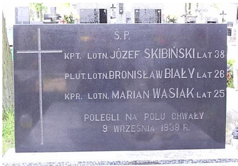
Mogiła poległych lotników na cmentarzu w Wojcieszkowie