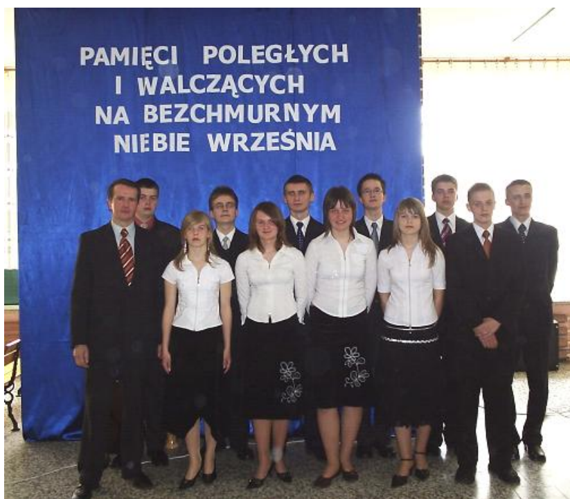
Artyści z IIIc (poza pierwszym z lewej)

Muszę przyznać, że wszyscy bardzo emocjonalnie zaangażowali się w całość uroczystości. Było to wydarzenie o szczególnym znaczeniu, ponieważ adopcja łączy się z podjęciem trudu opieki. Mieliśmy świadomość wielkiej odpowiedzialności jaką na siebie przyjęliśmy.