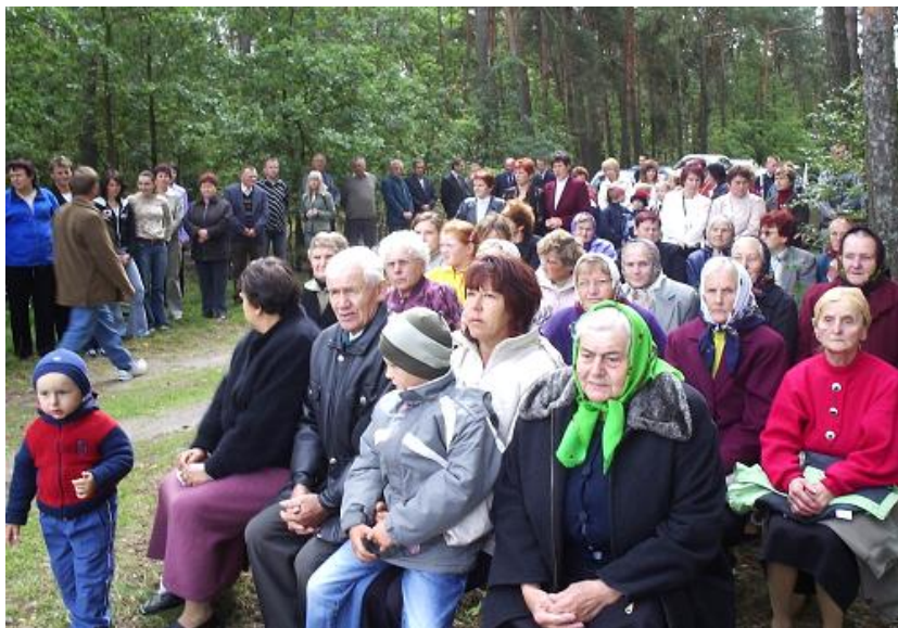
Uroczystości towarzyszyła podniosła atmosfera i zaduma

Uczestniczyły w niej lokalne władze, młodzież szkolna oraz licznie przybyli mieszkańcy okolicznych miejscowości, a wśród nich świadkowie wydarzeń z września 1939 r.