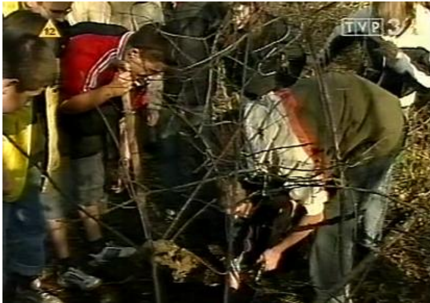
Uczniowie w czasie poszukiwań

W miejscu katastrofy, wspólnie z ekipą TV Lublin, przy użyciu wykrywaczy metalu, łopat oraz dzięki pomocy okolicznych mieszkańców odnaleźliśmy liczne szczątki samolotu.