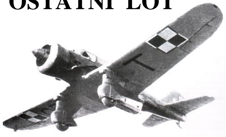
PZL - 23 B Karaś