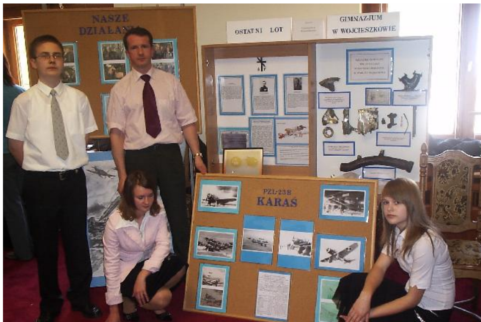
My w Pałacu Kultury i Nauki w Warszawie

Starłem się aby w miejscu katastrofy umieszczona została pamiątkowa tablica. Moimi planami zainteresowali się mieszkańcy Marianowa i Woli Bystrzyckiej. Dzięki ich zaangażowaniu w miejscu, w którym roztrzaskał się samolot, znalazły się trzy głązy symbolizujące trzech poległych lotników, a kilkadziesiąt metrów dalej, przy drodze, granitowy obelisk.