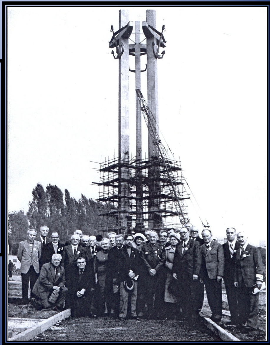
Gdańsk, Plac Trzech Krzyży