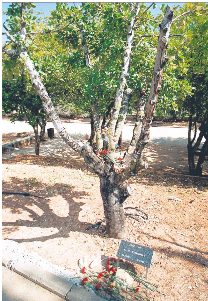
■ Instytut Yad Vashem i drzewko Sprawiedliwego - Raoula Wallenberga: szwedzkiego dyplomaty, który pracując na Węgrzech przyczynił się do uratowania tysięcy Żydów

W konsekwencji duńscy Żydzi przez długi okres okupacji mogli się cieszyć nieskrępowaną swobodą. Był to ewenement w skali okupowanego kontynentu. Skądinąd popularna historia o królu Chrystianie X, który na niemieckie żądanie, by duńscy Żydzi założyli na ramiona żółte opaski, miał odpowiedzieć, że on sam pierwszy to uczyni, okazała się propagandowym mitem, stworzonym jeszcze podczas wojny w środowiskach duńskiej emigracji w USA.