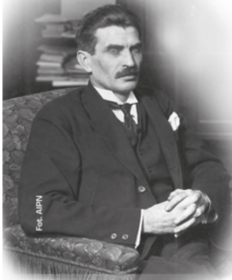
► Maciej Rataj, wieloletni marszałek Sejmu