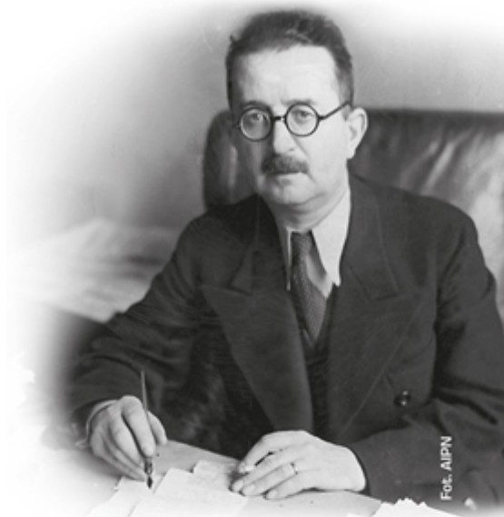
► Mieczysław Niedziałkowski, działacz socjalistyczny

postrzegany przez rodaków jako męczennik i bohater narodowy.