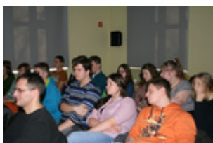
Uczestnicy projektu podczas warsztatów „Jak przygotować i przeprowadzić relację świadka historii?”, 5 II 2014 r., Rzeszów