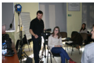
Warsztaty techniczne dla uczestników programu, 5 II 2014 r., Rzeszów