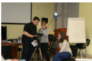
Warsztaty techniczne dla uczestników programu, 5 II 2014 r., Rzeszów