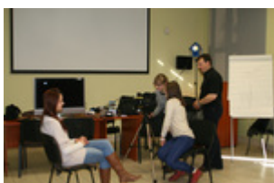
Warsztaty techniczne dla uczestników programu, 5 II 2014 r., Rzeszów