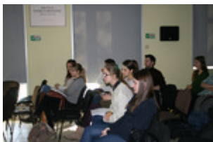
Uczestnicy projektu podczas warsztatów „Jak przygotować i przeprowadzić relację świadka historii?”, 5 II 2014 r., Rzeszów