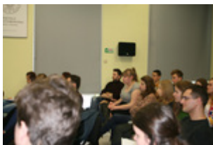
Uczestnicy projektu podczas warsztatów „jak przygotować i przeprowadzić relację świadka historii?”, 5 II 2014 r., Rzeszów