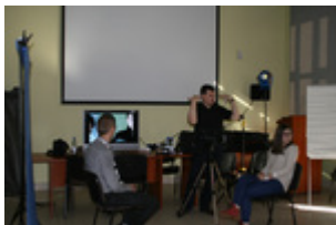
Warsztaty techniczne dla uczestników programu, 5 II 2014 r., Rzeszów