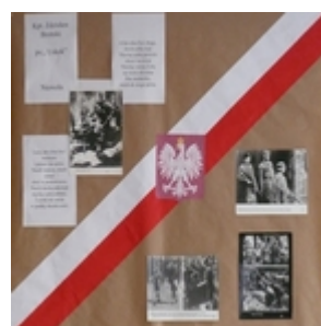
Fot.3. Gazetka okolicznościowa