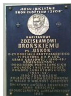
Fot.2.Tablica poświęcona Uskokowi