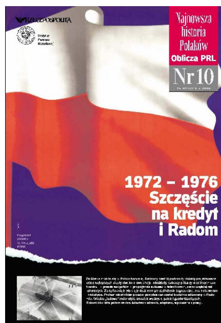
Polecamy archiwalny dodatek prasowy