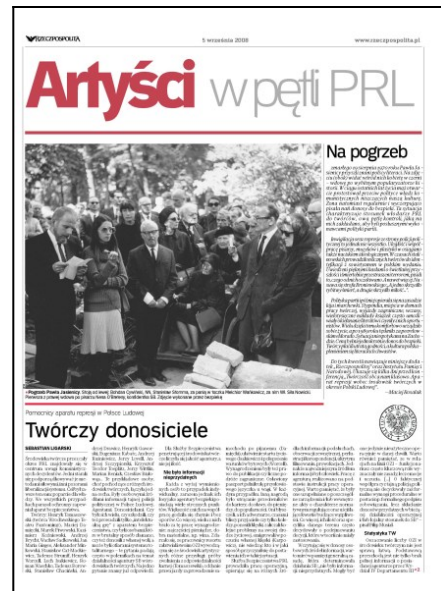
Polecamy archiwalny dodatek prasowy

Pretekstem do rozpętania afery wokół Rakowskiego stała się sprawa felietonów Jerzego Andrzejewskiego, od 1957 r. pozostającego poza PZPR [38] , drukowanych w „Polityce”, począwszy od września 1960 r. W jednym z nich autor wypowiedział się przeciwko karze śmierci, co zilustrował przykładem procesu poszlakowego, do jakiego doszło w Warszawie w 1958 r. Posłużyło to za pretekst do ataku na całą redakcję „Polityki” i określenia jej mianem rewizjonistycznej. Wysunięto bowiem argument, że tygodnik nie tylko podważa autorytet sądów, ale też kwestionuje pryncypia polityki PZPR, czyniąc to na dodatek piórem pisarza uważanego za opozycyjnego. W ówczesnej rzeczywistości oznaczało to wytoczenie najcięższych armat. W takiej sytuacji Starewicz jako kierownik Biura Prasy KC wystosował list do redakcji. Pisał w nim, iż publikacje Andrzejewskiego oraz inne dobitnie wskazały, że „Polityka” nie reprezentuje linii PZPR, szefostwo pisma zaś uznał za nielojalne. Puentował, stwierdzając: „W tej sytuacji Biuro Prasy KC nie widzi możliwości dalszego utrzymywania obecnego składu kierownictwa redakcji” [39] .