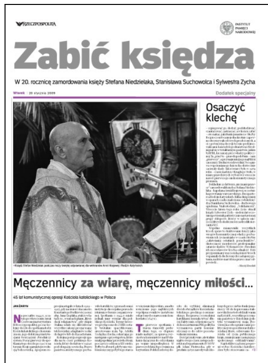
Archiwalny dodatek prasowy