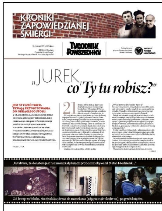
Archiwalny dodatek prasowy