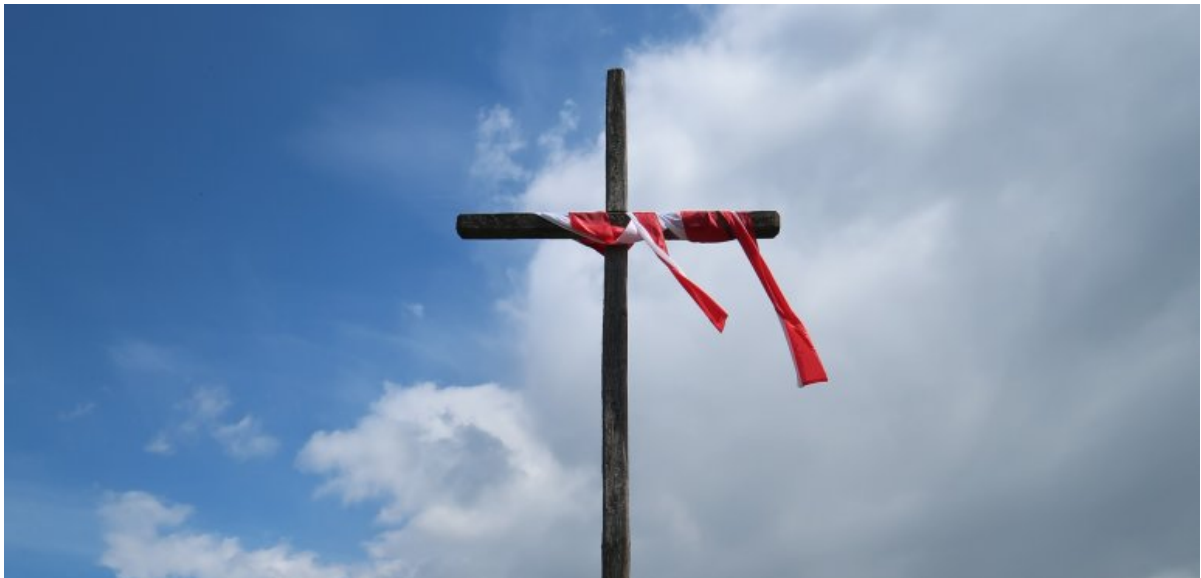
Pomnik w Gibach [Kliknij w fotografię, by powiększyć]