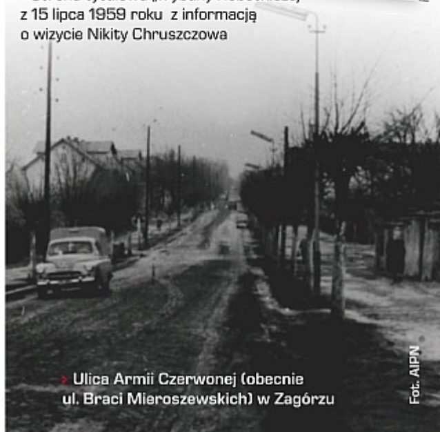
► Ulica Armii Czerwonej (obecnie ul. Braci Mieroszewskich) w Zagórz

Wojewódzkie władze partyjno-państwowe plany wizyty poznały znacznie wcześniej, by się do niej odpowiednio przygotować. Włodarzy ZSRR i PRL miały witać uśmiechnięte twarze ludzi stojących w szpalerach wzdłuż uporządkowanych ulic i kolorowych fasad domów. To zaś wymagało sporo zabiegów – trzeba było załatać dziury w nawierzchni i pomalować odrapane elewacje.