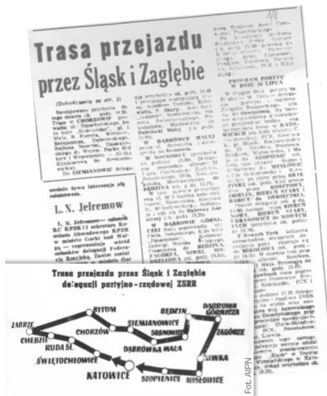
▶ Trasa przejazdu I sekretarza KC KPZR i premiera Związku Radzieckiego była podana do publicznej wiadomości