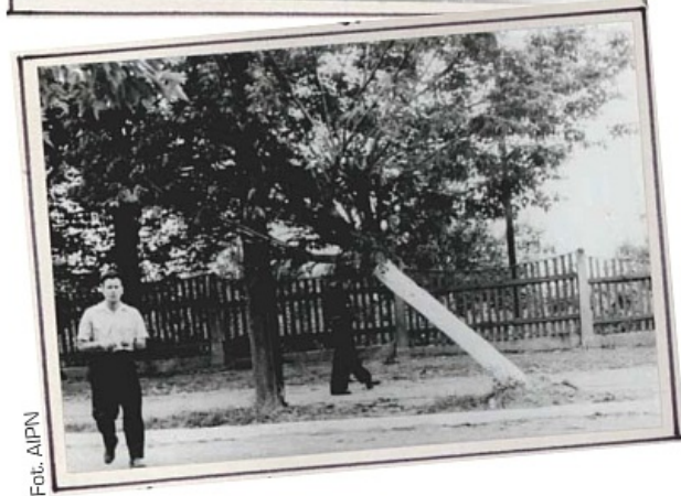
► Miejsce wybuchu bomby kilka dni po eksplozji – na zdjęciach widoczne uszkodzone drzewo

Po zebraniu szczegółowych informacji na temat poszczególnych podejrzanych i okoliczności eksplozji, przyszedł czas na weryfikację danych. Weryfikację bolesną dla prowadzących śledztwo. Okazało się bowiem, że ślady stóp w ogródku działkowym pozostawili uczestnicy nocnej libacji, a staranne sprawdzenie wykazało, iż żaden z nich nie miał związku z wybuchem bomby (jednym z pijących był patrolujący okolicę milicjant, którego zwolniono ze służby, a sąd wymierzył mu karę roku więzienia). Niewinni okazali się również robotnicy malujący parkan, jak też instalatorzy przewodów. Obserwacja mieszkańców Domu Górnika przyniosła jedynie kilkaset donosów, znakomicie opisujących życie tej społeczności. Taki materiał mógłby się zapewne okazać cenny dla socjologa, lecz nie przydał się zbyt w śledztwie (choć dowiedziano się w ten sposób o kradzieżach w kopalni, drobnych