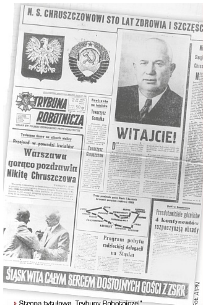
► Strona tytułowa „Trybuny Robotniczej” z 15 lipca 1959 roku z informacją o wizycie Nikity Chruszczowa

Radziecka delegacja partyjno-rządowa przyleciała do Warszawy 14 lipca. Następnego dnia Chruszczow miał się pojawić w Katowicach i wraz z Gomułą oraz I sekretarzem miejscowego Komitetu Wojewódzkiego PZPR Edwardem Gierkiem zwiedzić Górnośląski Okręg Przemysłowy. Szczegółowy program wizyty opublikowała lokalna prasa. „Trybuna Robotnicza”, organ KW PZPR w Katowicach, zamieściła na swych łamach mapkę trasy, którą miała się poruszać kawalkada pojazdów z gośćmi, a także podała orientacyjny czas przyjazdu do poszczególnych miejscowości.