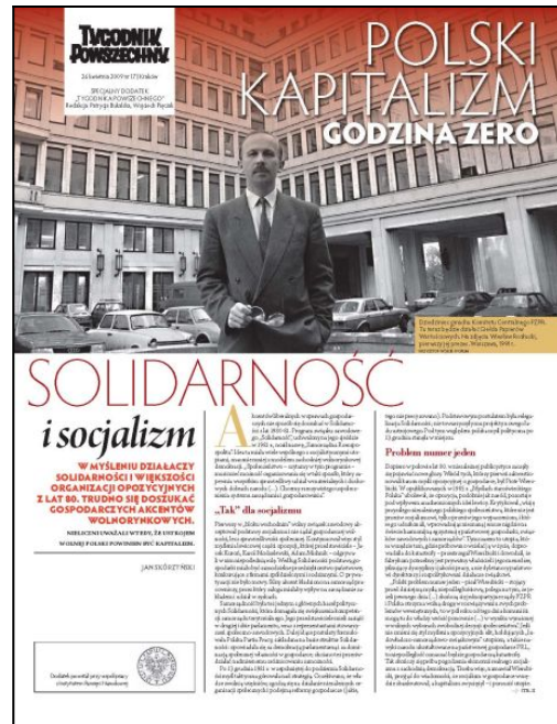
Archiwalny dodatek do prasy

Pałac był wielokrotnie świadkiem wielkich wydarzeń. Może V Światowy Festiwal Młodzieży i Studentów do nich nie należał, ale warto go tu wspomnieć, bo miał miejsce tuż po inauguracji działalności PKiN. Za to do wydarzeń wręcz symbolicznych trzeba zaliczyć wiec, który odbył się 24 października 1956 roku, po powrocie Władysława Gomułki do władzy. Trudno oszacować, ile tak naprawdę osób przyszło wówczas na pl. Defilad – mówi się o 300 tys. lub nawet 500 tys. (co zdaje się grubą przesadą). W każdym razie było to najliczniejsze w Polsce zgromadzenie autentycznie popierające politykę kierownictwa partii komunistycznej.