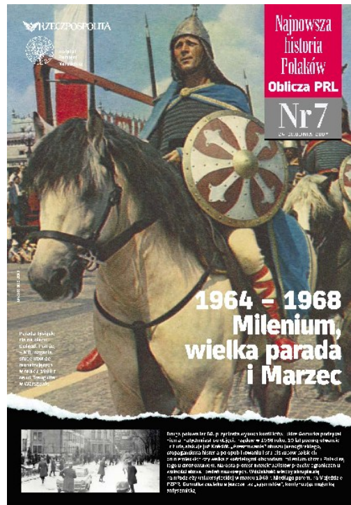
Archiwalny dodatek do prasy