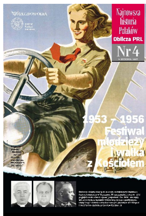
Archiwalny dodatek do prasy

Inną szokującą propozycją, która padła w dyskusjach architektów, a nawet została przedstawiona w formie graficznej w książce, był pomysł Edmunda Goldzamta, aby wyburzyć cały obszar od frontu pałacu w kierunku skarpy wiślanej, aby w ten sposób wyeksponować ten pomnik polsko-radzieckiej przyjaźni. Książka wyszła już w okresie odwilży i nie trafiła do dystrybucji, lecz na przemiał.