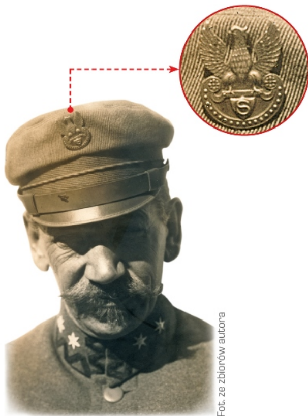
► Porucznik Jędrzej Moraczewski z I Brygady Legionów Polskich, późniejszy premier RP; na maciejówce orzeł strzelecki

Bywało też, choć rzadziej, że właśnie poprawna identyfikacja chroniła posiadacza orła przed kłopotami. Przypadek taki, który zdarzył się Komendantowi w pierwszych dniach listopada 1918 roku w Berlinie, został odnotowany przez księcia Zdzisława Lubomirskiego: „Piłsudski [...] zakomunikował nam, że w Berlinie rewolucja jest w pełni. Żołnierze, rozbijając oficerów, zdejmują im oznaki. Do niego, będącego w mundurze legionowym, podeszli również niemieccy żołnierze, widocznie zamierzając tak samo postąpić, lecz zauważywszy orzełka na czapce, zaniechali wszelkich czynów, mówiąc: »Es ist ein polnischer Offizier«”.