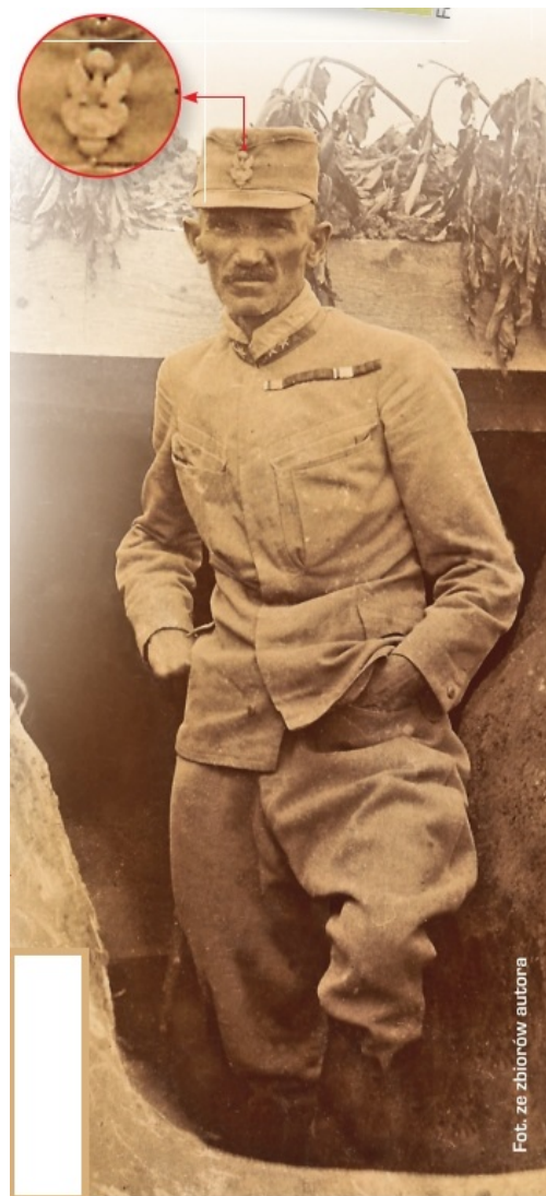
Pułkownik Zygmunt Zieliński, dowódca 2. pułku piechoty, potem III Brygady, a do 1918 roku Polskiego Korpusu Posiłkowego - w czerwcu roku 1915 w okopach pod Rarańczą nosił na czapce orła pod austriackim bączkiem