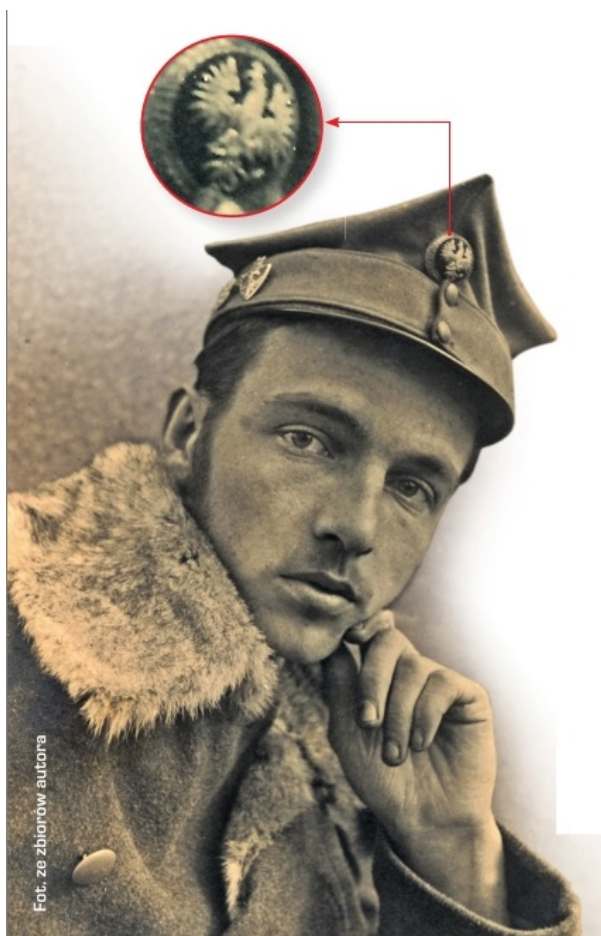
Oznaka Drużyn Bartoszewskich noszona w czasie wojny przez legionistę z II Brygady; zwraca uwagę uszkodzony orzeł z urwaną nogą

jedliny za biało-czerwoną kokardą, jednakowe kożuszki z odpiętymi wyłogami, karabinki i szable, dobrane pod maść i wzrost jednakowe konie gniade”. Na łamach legionowego czasopisma „Konferencja Pokojowa” karykaturzysta sarkał na to, że rozkaz ozdobienia czapek ułani otrzymali dopiero w ostatniej chwili. Noszenie gałązek było usankcjonowane rozkazami mundurowymi; na przykład rozkaz mundurowy 4. pułku piechoty wydany w miesiąc po utworzeniu go mówił: „Znak polowy, gałązkę sosny nosi się po lewej stronie czapki”. Flora terenu walk wymusiła elastyczność w podejściu do rozkazu; w Karpatach łatwiej było o świerki niż o sosny. Obyczaj zaczerpnięty z armii austro-węgierskiej dotrwał do roku 1919, gdy w dziale Przepisy ogólne rozkazu wprowadzającego nowy ubiór polowy Wojska Polskiego umieszczono punkt 8: „Zwyczaj majenia czapek zielenią jako obcy znosi się”.